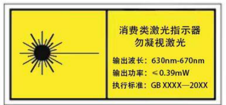
图3 消费类激光指示器产品警示和说明标记示例

警示和说明标记应粘贴在消费类激光指示器产品适宜的位置上。在使用期间，标记应耐用，永久固定，字迹清楚，明显可见。图3中给出了警示和说明标记示例。